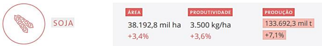
Figura 1 - Safra 2020/21 em comparação com safra 2019/20

O expressivo interesse nessa cultura se dá pela diversidade que o grão pode originar, como óleos, combustíveis biodegradáveis, ração animal, alimento humano e outros (TODESCHINI, 2018). A demanda dessa oleaginosa é crescente, e graças aos investimentos em tecnologias e em programas de melhoramento, a produção de soja na safra 2020/21 pode chegar a 133,6 milhões de toneladas no país, registrando crescimento de 7,9 milhões de toneladas na produção total, um incremento de 7,1% em relação à safra 2019/20 como demonstrado na Figura 1 (CONAB, 2021).